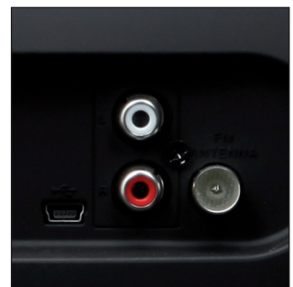
Neben Antennen- und Aux-Eingang ist ebenfalls eine Mini-USB-Buchse vorhanden.

und sehr druckvolle Bass auf, der bis unter 50 Hertz hinabreicht. Eine freie Aufstellung ist da hilfreich. Die Höhen hingegen kommen etwas zu schwach. Dafür reichen die sehr hohen Pegel auch für Party-Zwecke.